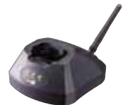
GPRS Cradle (Quadband)